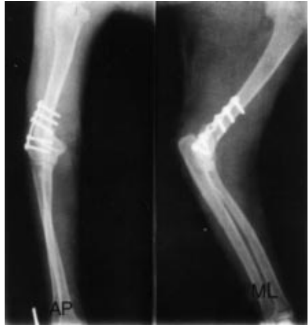
Şekil 6. Sol humerus, Salter-Harris Tip 1 kırığı. Operasyon sonrası radyografik görüntüleri (AP, ML).