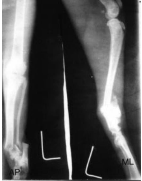
Şekil 2. Sol tibia, Salter-Harris Tip 2 kırığı. Operasyon öncesi radyografik görünümleri (AP, ML).

Çalışmamızda toplam 15 adet Salter – Harris ( SH ) tip 1 kırıklarından 9'unun 1 yaşın altında olduđu (%60) izlendi. Literatür verilerde SH tip 1 kırıkları 6 aydan küçük hayvanlarda izlenmektedir (18, 20). SH tip 2 kırıkları ise genelde 6 aydan büyük olgularda izlenirken, çalışmada 5 adet SH tip 2 kırığından 4'ünün 1 yaşın altında olduđu izlendi. Tip 4 kırıklarının ise ergin hayvanlarda yaygın olduđu belirtilmektedir. Bu çalışmada rastlanılan 2 adet SH tip 4 kırığı olgularının 1 yaşın üzerinde oldukları belirlendi (7, 18-21).