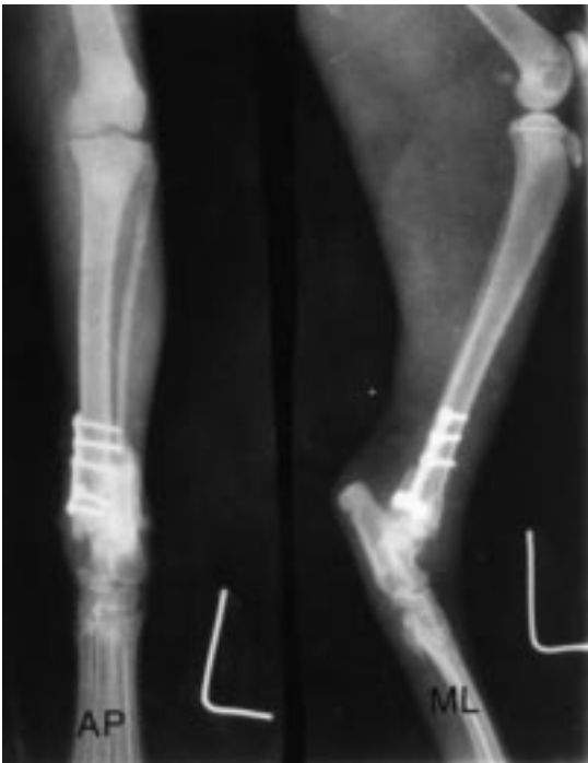
Şekil 5. Sol tibia, Salter-Harris Tip 2 kırığı. Operasyon sonrası radyografik görüntüleri (AP, ML).