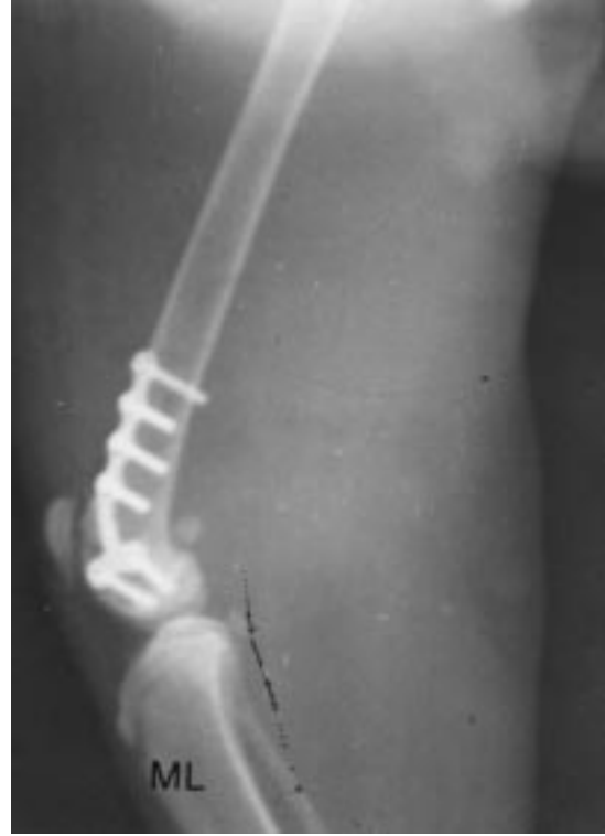
Şekil 4. Sol femur, Salter-Harris Tip 2 kırığı. Operasyon sonrası radyografik görünümü (ML).