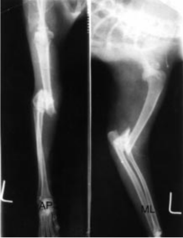
Şekil 3. Sol humerus, Salter-Harris Tip 1 kırığı. Operasyon öncesi radyografik görüntüleri (AP, ML).