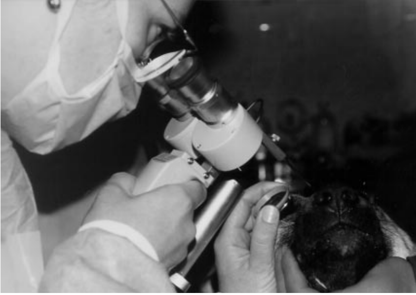
Şekil 2. Kangal Köpeğinde Gonioskop ve Slit-Lamp'ın Uygulanışı.