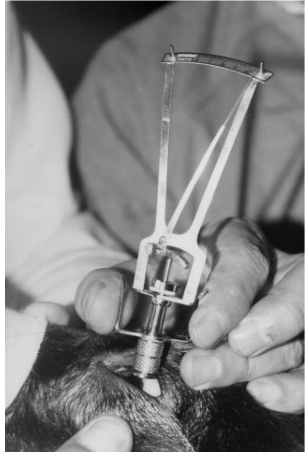
Şekil 1. Köpekte Schiøtz's tonometresinin uygulanışı.

Saptanan Schiøtz tonometrik bulguları ortalama standart saptamaları formülüne uygun şekilde hesaplanarak objektif değerler bulunmaya çalışıldı.