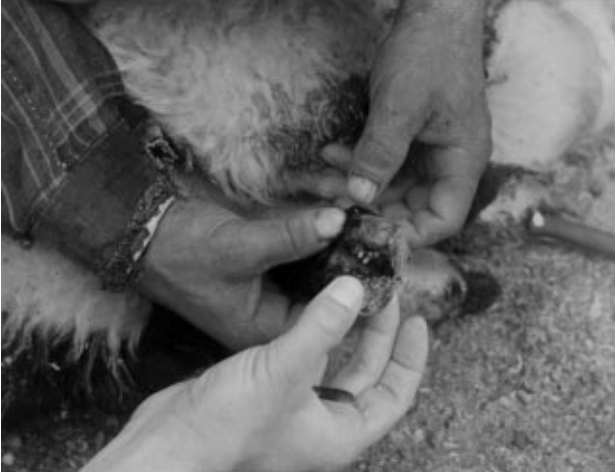
Şekil 1. Koyunda Tırnak Arasındaki Myiasisin Görünüşü.

Woodburn (34), Avusturalya'da L. sericata 'yı, L. cuprina 'nın oluşturduğu myiasis yaralarında sekonder etken olarak tespit etmişlerdir. French ve ark. (23), İngiltere'de L. sericata 'nın sebep olduğu myiasislerin %1.5-1.6 oranlarında bulunduğunu belirtmişlerdir. Dear ve ark. (12), Yeni Zelanda'da myiasisin büyük bir problem olduğunu, 1976-1984 yıllarında tespit edilen 91 vakasının %37.4'ünde L. sericata 'nın varlığını saptamışlardır. Kostov ve ark. (35), Bulgaristan'da tespit ettikleri myiasis vakalarında L. sericata ve W. magnifica 'nın larvalarına rastladıklarını, myiasis vakalarının koyunlarda %16-18 oranında görüldüğünü belirlemişlerdir. Wall ve ark. (36), İngiltere'de 32 vakadan topladıkları larvaların laboratuvarında gelişmelerini sağladıktan sonra yaraların 26 (%81)'sini sadece L. sericata 'nın, dördünü (%13) L. sericata ile L. caesar 'ın birlikte oluşturduklarını tespit etmişler ve myiasis