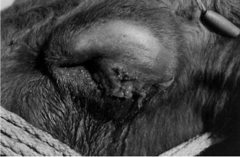
Şekil 3. Sığırdaki Gözdeki Myiasisin Görünüşü.