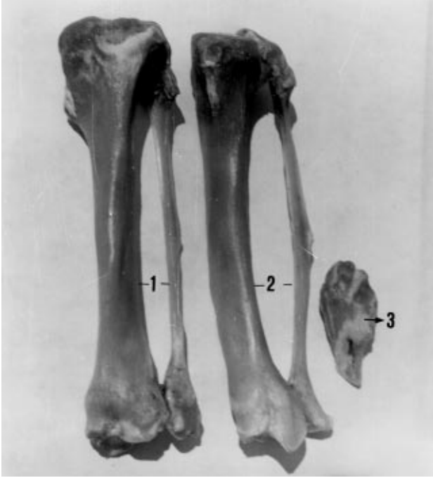
Şekil 3. Skeleto cruris'in 1) cranial, 2) caudal'den görünüşü, 3) patella'nın cranial'den görünüşü.

Femur: Collum ossis femoris incedir, fossa trochanterica ise oldukça derindir. Caput ossis femoris üzerinde fovea capitis bulunmamakta, bunun yerinde az