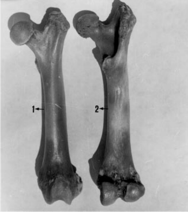
Şekil 2. Femur'un 1) cranial, 2) caudal'den görünüşü.

yapımışlardır. Fakat oklu kirpilerde iskelet sistemi üzerinde yapılmış kendi çalışmamız (15) hariç herhangi bir çalışmaya rastlanılmadı.